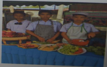
โรงพยาบาลส่งเสริมสุขภาพตำบลน้ำเกี๋ยน

ประมวลภาพกิจกรรมส่งเสริมสุขภาพกลุ่มวัยเรียน